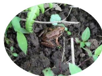
小さなニホンアカガエル