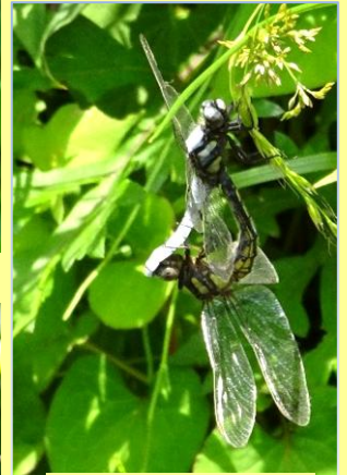
シオヤトンボみ♀ 交尾中のカップル