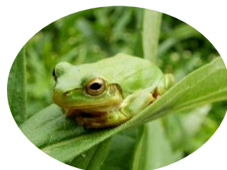
シュレーゲルアオガエル