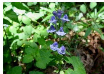
ヤマタツナミソウ