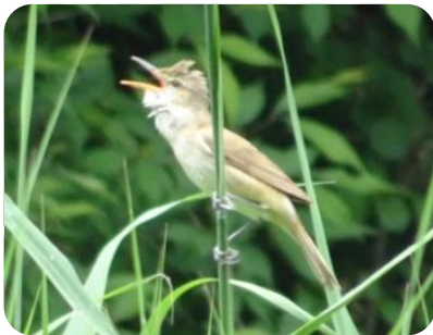
「ギョギョシ ギョギョシ」 オオヨシキリが鳴いてます