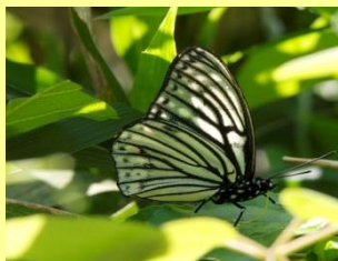
アカボシゴマダラ