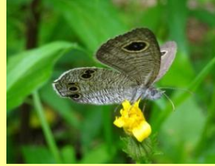
ヒメウラナミジャノメ